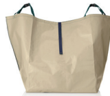
マルチトートマット

2人で持ち運べるバッグ、カーシート、レジャーシートと3WAYに変身するマルチなトート。