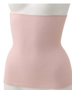
ボディウォーマー