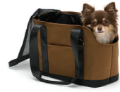
ペットキャリーバッグ

2人で持ち運べるバッグ、カーシート、レジャーシートと3WAYに変身するマルチなトート。