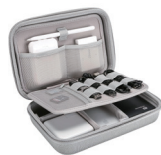
ガジェットポーチ