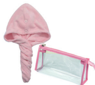
吸水ヘアターバン